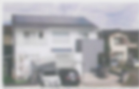
岡山県、岡山大学総合センター施設に太陽光発電設備の導入が完了しました。

岡山県、岡山大学総合センター施設に太陽光発電設備の導入が完了しました。この施設は、岡山大学総合センター施設の一部で、岡山大学総合センター施設の一部です。この施設は、岡山大学総合センター施設の一部で、岡山大学総合センター施設の一部です。