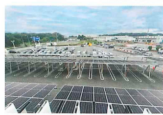
様々な屋根に対応。カーポートの導入実績も持つ

岡山県、岡山大学総合センター施設に太陽光発電設備の導入が完了しました。この施設は、岡山大学総合センター施設の一部で、岡山大学総合センター施設の一部です。この施設は、岡山大学総合センター施設の一部で、岡山大学総合センター施設の一部です。