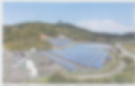
岡山大学総合センター施設に太陽光発電設備の導入が完了しました。

岡山県、岡山大学総合センター施設に太陽光発電設備の導入が完了しました。この施設は、岡山大学総合センター施設の一部で、岡山大学総合センター施設の一部です。この施設は、岡山大学総合センター施設の一部で、岡山大学総合センター施設の一部です。